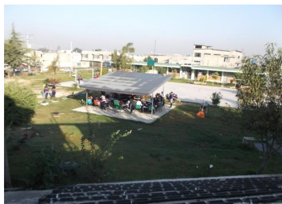
3 Terreno Chocolín actual..

La Preparatoria 55 nació en 1988 para atender la demanda Educativa de los jóvenes rechazados o carentes de oportunidades de estudio en la zona. Un principio social que le ha caracterizado es el ingreso irrestricto, razón por la cual ha