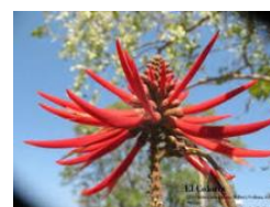
1 Planta Zompantele

Corresponde esta ubicación a una zona baja en las faldas del cerro del Chocolín, nombrado así en el pasado aludiendo al árbol Zompantele o colorín de la especie Erythrina Americana Miller,