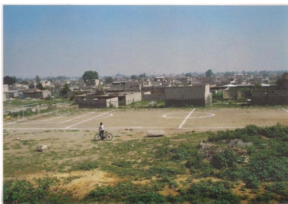
2 Terreno Chocolín.

también llamado localmente Chocolín la zona es una superficie de tierra asignada al ejido de Santa María Nativitas, cuyos ejidatarios habitaban en la demarcación de Chimalhuacán, municipio vecino, pero geográficamente se ubicaba en el territorio del municipio de Chicoloapan, sin embargo, los usos y costumbres además de intereses político-electorales durante la gestión de Enrique Peña Nieto como gobernador del Estado de México determinaron que fuera decretado territorio de Chimalhuacán, a pesar de que no hay una continuidad entre el polígono de este ejido y los límites municipales.