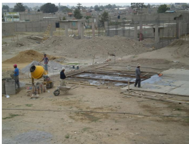
4 Construcción de Alulas y cancha.

Siendo el suelo del “Chocolín” una superficie de aproximadamente una hectárea con una zona de mediana pendiente en su porción sur, tierra ejidal dedicada a la agricultura de riego y de temporal, son la mayoría de los asentamientos humanos contemporáneos respecto a la construcción de la escuela, no se cuenta con servicio de agua ni de drenaje, el servicio municipal de recolección de basura es deficiente, como también todo servicio e infraestructura urbana.